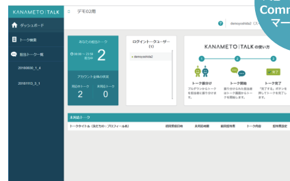
お客様との直接的なコミュニケーション