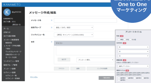
特定のニーズを持った人のニーズに合致した情報配信